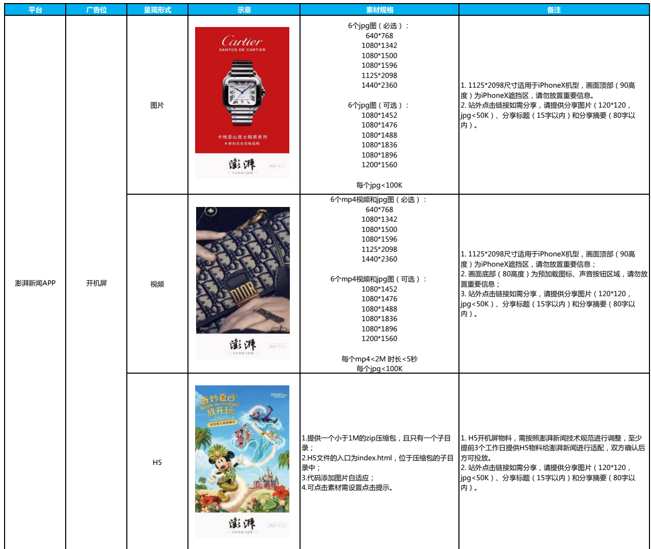
附件：澎湃新闻广告素材规格表